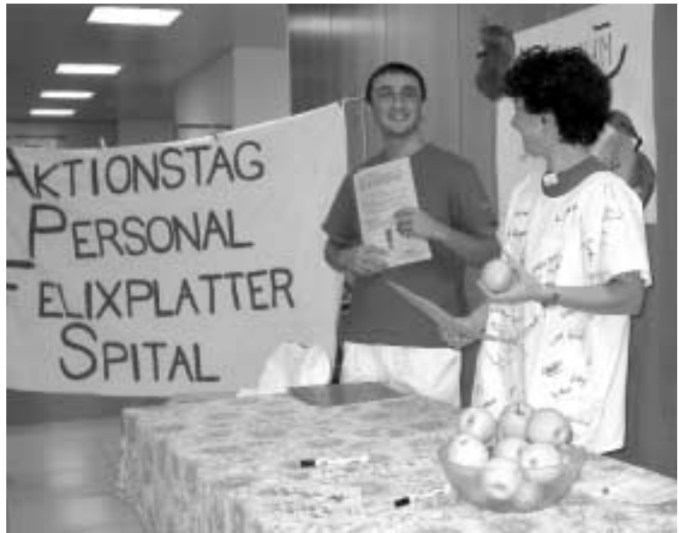
Farbenfroher Aktionsstand in der Eingangshalle

Vor einem Jahr, am 14. November 2001, sind über 6000 Mitarbeitende des Gesundheitswesens auf die Strasse gegangen. An Aktionen in den einzelnen Häusern und Betrieben haben sich mindestens so viele beteiligt. Unsere Forderungen waren: Weniger Stress – mehr Personal, die Realisierung einer zusätzlichen Ferienwoche.