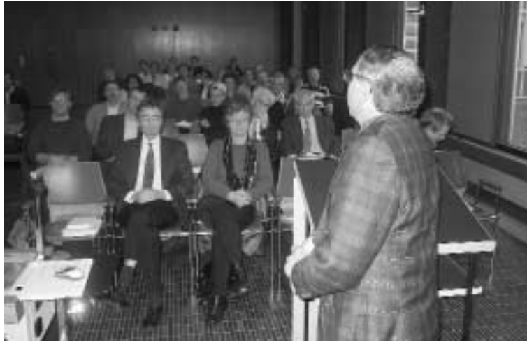
Gründungsversammlung des SFGG im Grossen Saal

Obwohl die Zielsetzungen des neuen Vereins den Anschein erwecken könnten, vermehrt standespolitische Anliegen ins Zentrum der Anstrengungen zu stellen, wird die SFGG die Grundideen und Anliegen ihrer alten Mutter nicht vergessen. Im Gegenteil: die Interdisziplinarität wird weiterhin im Zentrum der täglichen Arbeit stehen. Im Gegensatz zu anderen Fachgesellschaften, bei denen durch die Spezialisierung eine zunehmende Monodisziplin entstand, erhebt die Spezialisierung in der Altersmedizin die Interdisziplinarität zum Prinzip. Die Kommunikation und die Zusammenarbeit mit anderen Berufsgruppen sind denn auch in den neuen Statuten verankert. Die Altersmedizin ist somit eine der bereicherndsten Tätigkeiten, die man sich als Arzt oder Ärztin denken kann. Die zentralen Anliegen der SFGG sind: Erhalt und Förderung des geriatrischen Know-hows zu Gunsten unserer betagten Patientinnen und Patienten.