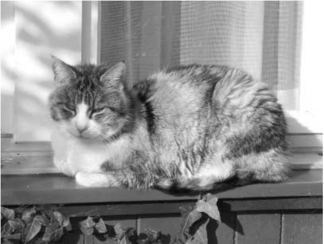
Ivana, Hauskatze im Gebäude B, fühlt sich seit über 16 Jahren wohl im Felix Platter-Spital!

Felix Platter-Spital Postfach 4012 Basel