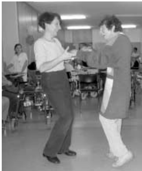
Viel Freude am Tanzen mit fast 100 Jahren

Auf Jahreszeiten bezogene Aktivitäten anbieten und Bezüge zu kulturellen Anlässen schaffen sind Beispiele des Angebotes der Aktivierungstherapie. Zum Thema «Herbstmäss» haben wir uns daher einiges einfallen lassen.