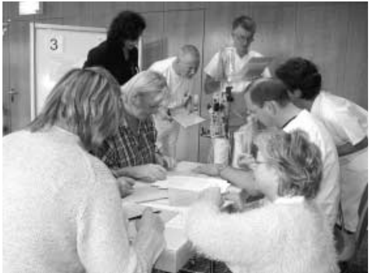
Gezielte Einführung in den Stationsbetrieb

In unserem Pflegedienst werden Richtlinien zu einzelnen Aufgaben in einem sogenannten Karteikartensystem abgelegt. Den MitarbeiterInnen steht dieses Nachschlagewerk in ihren Arbeitsräumen zur Verfügung. Am 27.11.2002 wurden neue und überarbeitete Inhalte der Kartei den StationsleiterInnen und ihren StellvertreterInnen vorgestellt und abgeben.