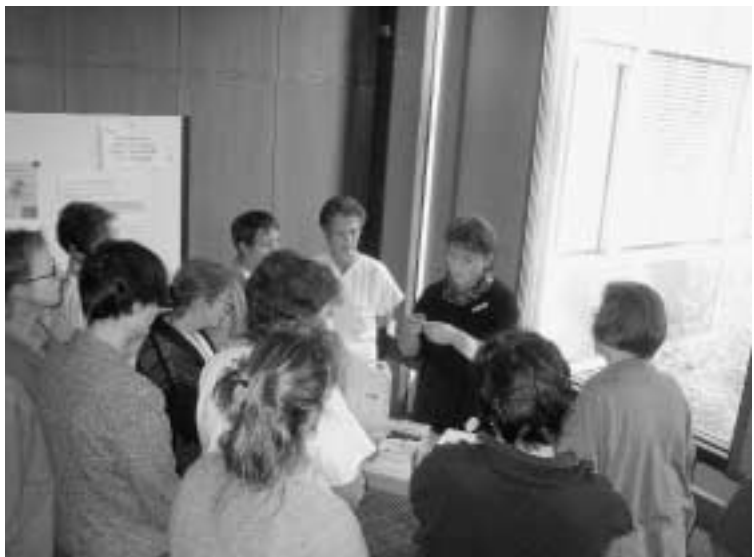
Hilfestellung für eine strukturierte Umsetzung