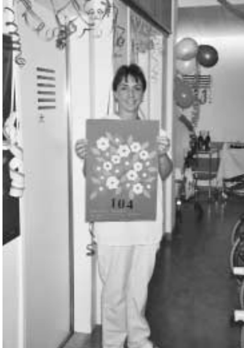
Herzliche Gratulation

Kein Wunder mundeten der Festgemeinschaft auf dem 8. Stock all die Herrlichkeiten auf dem Kuchen- und Tortenbüfett mit Kaffee oder Wein! Viel zu schnell verging die Zeit an diesem Nachmittag. Zum krönenden Abschluss dieses vergnügten Beisammenseins wurde auf Wunsch der Jubilarin Sekt gereicht.