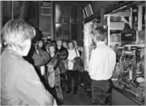
Interessanter Einblick in die Arbeit der Berufsfeuerwehr

Unser diesjähriges Jubilarentreffen konnte am Donnerstag, 21. November 2002 durchgeführt werden. Rund 40 Personen haben an der interessanten und lehrreichen Besichtigung der Berufsfeuerwehr Basel-Stadt teilgenommen.