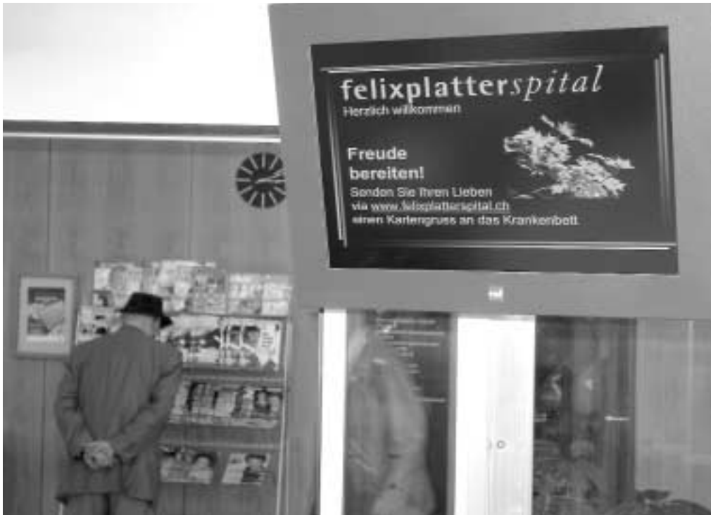
Das neue VisiWeb-Multimedia Anzeige- und Informationssystem

Seit Anfang Dezember informieren wir alle Besucherinnen und Besucher beim Haupteingang unseres Spitals mit einem modernen Informations-Bildschirm. Das attraktive Informations-System, VisiWeb, erfüllt fast alle Wünsche an das Darstellen von Informationen. Die Bildinhalte können als statische oder animierte Seiten und auch als Lauftext aufbereitet werden. Events und Veranstaltungen werden so ideal und optisch ansprechend kommuniziert. Die Inhalte werden von den Mitarbeitenden der Kommunikationsdienste in der Informationszentrale entgegengenommen, koordiniert und aufbereitet.