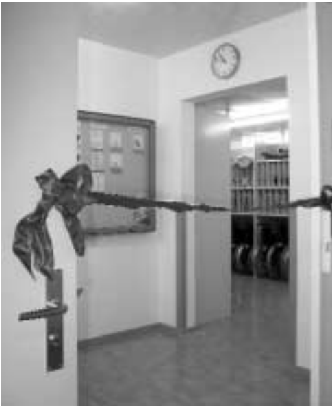
Das Band ist bereit. Der Pool kann eröffnet werden