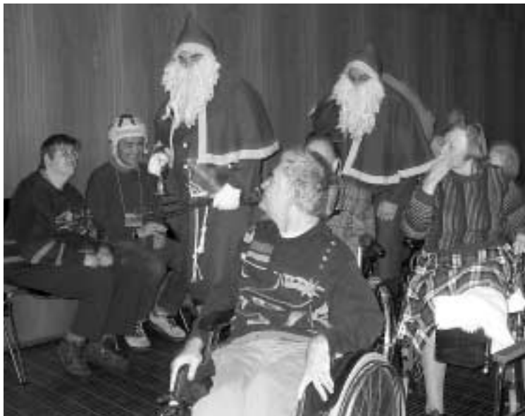
St. Nikolaus und Schmutzli treffen im Grossen Saal ein

Am 7. Dezember besuchte St. Nikolaus das Felix Platter-Spital. Die vielen erwartungsvollen Gäste erlebten, als willkommene Abwechslung zum Spitalalltag, eine stimmungsvolle Feier.