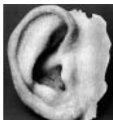
Epithese Silikon-Rekonstruktion des äusseren Ohrs Kantonsspital Basel

der Klinik und der Medizinal-Industrie bilden einen weiteren Schwerpunkt der Ausstellung. Von der Nase aus Silikon, die mittels Druckknöpfen befestigt wird, über künstliche Blutgefässe bis hin zum «neuen» Magen aus einem Stück Darm – die Möglichkeiten der modernen Medizin scheinen grenzenlos und der Mensch ein Wesen mit beliebig austauschbaren «Ersatzteilen». Ein Blick zurück in die Geschichte zeigt, wie nah die heutige Medizin uralten Wunschvorstellungen der Menschheit gekommen ist, dass ihr allerdings auch Grenzen gesetzt sind, kommt dabei ebenfalls zum Ausdruck.