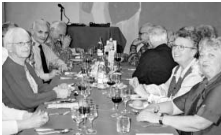
Zum Abschluss ein feines Nachtessen im Personalrestaurant