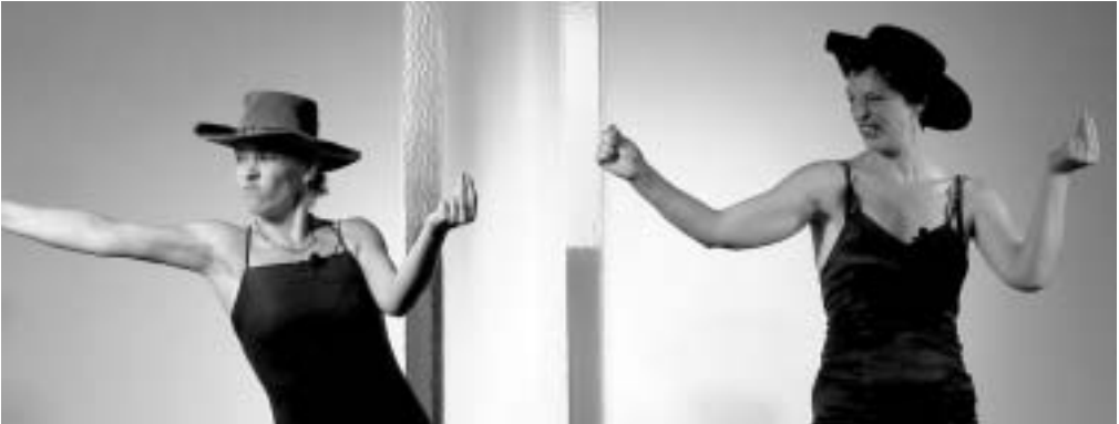
Fatal dö in Aktion