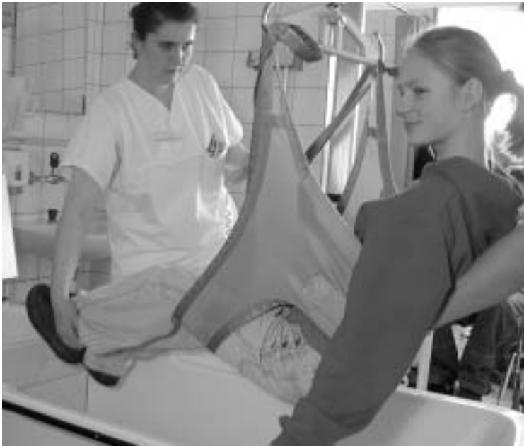
Entspannt in die Badewanne

Die Projektidee «Alt und jung – einen Tag gemeinsam», einer Sekundarschulklasse aus Binningen, im Rahmen ihres Religionsunterrichtes, legte den Grundstein zu einem lebendigen und erlebnisreichen Tag im Sektor 3. Dies sowohl für die Patientinnen und Patienten, das Team der Aktivierungstherapie, der Pflegenden und nicht zuletzt der Schulklasse.