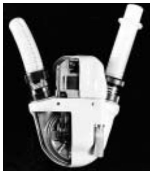
Kunsterz Novacor® Edwards Lifesciences AG, Horw