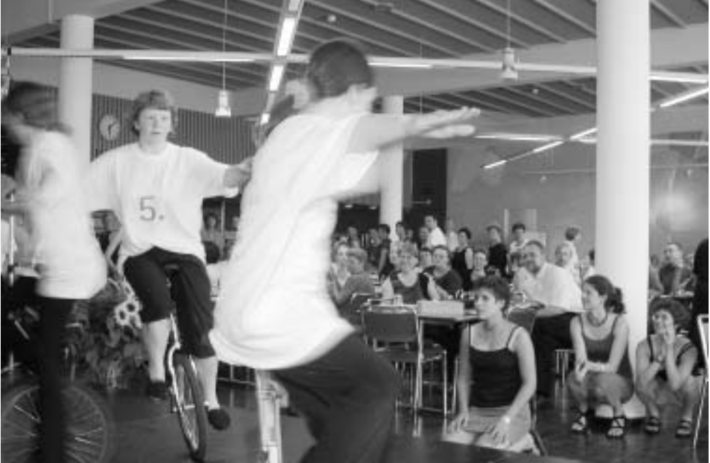
Die ArtistInnen des Jugendzirkus Robiano symbolisieren die Bewegung

Ganz auf das Leitbild mit dem Slogan «das Felix Platter-Spital ist und bleibt in Bewegung» sind die Kinder und Jugendlichen des Zirkus Robiano eingestellt. Sie waren beim Jonglieren, beim Einradfahren und bei zahlreichen anderen Kunststücken immer in Bewegung. Dabei trugen sie die sieben Leitsätze auf einem T-Shirt immer mit sich auf dem Rücken.