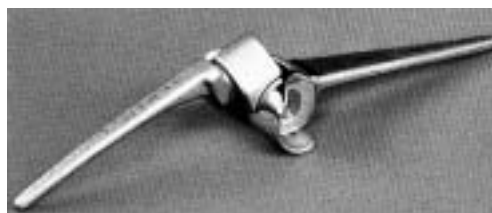
Ellbogengelenk-Prothese GSB III® Sulzer Orthopädie Münsingen

In der Ausstellung wird eine Auswahl moderner Verfahren vorgestellt, mit denen biologische Strukturen des menschlichen Körpers ersetzt werden können. Dabei wird jeweils die Form und Funktion des gesunden Organs erläutert und dazu dessen Ersatzmöglichkeiten aufgezeigt. Modelle, Fotografien, Legenden und Zeichnungen veranschaulichen dieses spannende Thema auf attraktive Weise. Kostbare Exponate aus