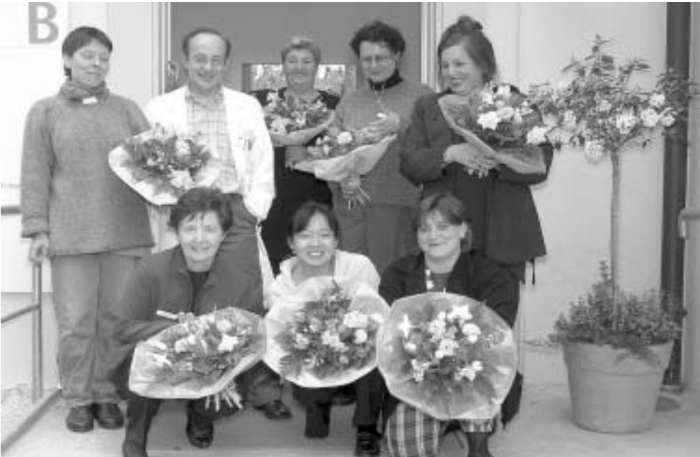
Das Team der psychogeriatrischen Tagesklinik

Neben dem fortschreitenden Verlust von geistigen und praktischen Fähigkeiten (Gedächtnis, Erfassen von Zusammenhängen, Alltagsplanung etc.) treten bei den meisten Demenzkranken so genannte Verhaltensstörungen – zumindest phasenweise – in den Vordergrund. Zu diesen Störungen gehören Depression, Angst, Unruhe, Erregung, Aggressivität, Störungen des Schlaf-Wach-Rhythmus, Wahn und Halluzinationen.