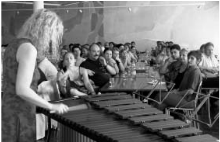
Mallet-Syncopators begeistern mit Marimbaklängen