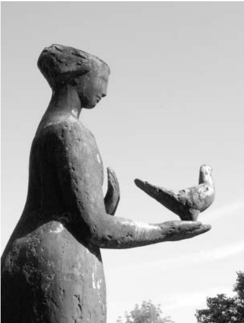
Seit 20 Jahren im Garten des FPS: Mädchen mit Taube (Beitrag Seite 22)

Felix Platter-Spital Postfach 4012 Basel