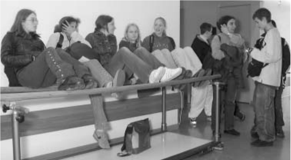
Muntere SchülerInnen- schar im FPS

Das anschliessende, gemeinsame Mittagessen bleibt wohl einigen der Schülerinnen und Schüler sowie den Patientinnen und Patienten ein unvergessliches Erlebnis.