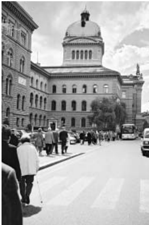
Auf dem Weg ins Bundeshaus

Für den diesjährigen Personalanlass haben sich beinahe hundert Personen für den Ausflug und weitere 18 Gäste für das Nachtessen angemeldet. Pünktlich um 13.00h – bei prächtigem Wetter – starteten die 2 Reiseautos Richtung Bern. Nach der Ankunft mussten die Teilnehmerinnen und Teilnehmer zuerst die strengen Sicherheitskontrollen durchlaufen, bevor die interessante Führung im Bundeshaus beginnen konnte. Eine herrliche Fahrt durch den Jura und das Laufental brachte anschliessend die Gäste ins Felix Platter-Spital zurück, wo bereits weitere ehemalige Mitarbeiterinnen und Mitarbeiter sowie die Spitalleitung sie zum Apéro erwarteten. Das köstliche Abendessen hat das Küchenteam wiederum mit viel Können und natürlich in der bestens bekannten Qualität zubereitet und serviert. Das gemütliche Beisammensein, die vielen Gespräche, aber auch die musikalische Umrahmung durch Herrn A. Nichele rundeten den sehr schönen Tag ab.