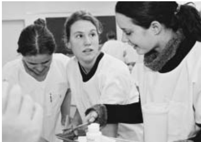
Spannender Praxisunterricht in guter Atmosphäre