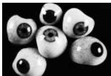
Künstliche Augenschalen aus Glas J. Müller-Welt Stuttgart