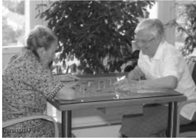
Der Spieltisch bereitet viel Freude

16. Mai 2002: Das Endprodukt steht auf der Station! Es kann gespielt werden. Nach der Einführungs- und Bewährungszeit, nach Abwägen der Pro und Contra könnte – nach Überwiegen der Pro – der Startschuss zum zweiten Spieltisch-Hürdenlauf fallen.