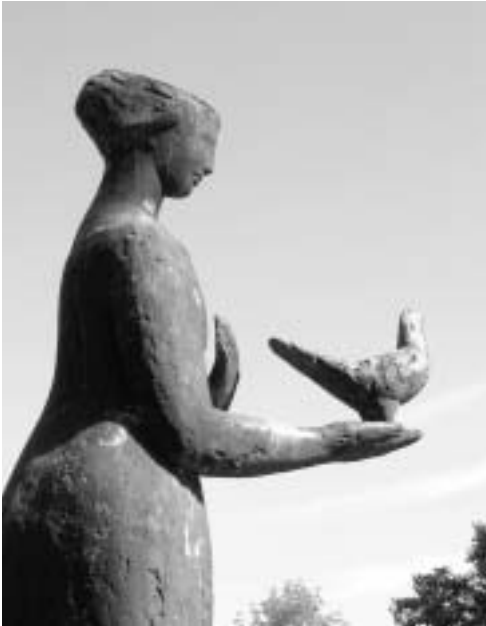
Seit 20 Jahren im Garten des FPS: Mädchen mit Taube

«Im Rasen vor dem Hauptgebäude des Felix Platter-Spitals steht nun schon seit bald zwanzig Jahren eine Frauenfigur aus Bronze. Auf ihrer ausgestreckten Hand steht eine Taube, die munter in die Ferne guckt, so, als ob sie jeden Augenblick davonfliegen wollte.»