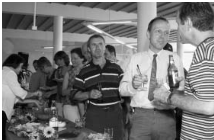
Bei über 30° C im Saal sind kühle Getränke sehr willkommen

Nach Terminplan werden sich die Spitalleitung und das Kader bereits im dritten Quartal mit der praktischen Umsetzung des Leitbilds auseinandersetzen. Gegen Ende des laufenden Jahres gibt es dann entsprechende Gespräche und Workshops auch für alle anderen Angestellten des Spitals. «Es wird ein langer Weg, bis dieses Leitbild umgesetzt ist», sagte Conzelmann. «Doch auch hier gilt: Der Weg ist das Ziel.»